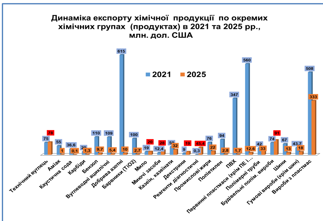
Діаграма 3. Динаміка експорту хімічної продукції у розрізі окремих хімічних продуктів (груп хімічної продукції) в 2021 та 2025 рр.

Загалом слід зазначити, що зупинка ключових хімічних підприємств та регулятивні обмеження експорту азотних добрив призвели до критичного зменшення експорту великотоннажної хімічної продукції (хімічна сировина та напівсировина), який об'єктивно не може бути компенсоване збільшенням експорту малотоннажних і середньотоннажних хімічних продуктів та сталим експортом продукції окремих великотоннажних хімічних виробництв.